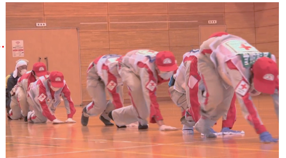
避難所で床の消毒清掃を行う日赤職員

2016年の熊本地震でも、地震発生から1週間もたたないうちに避難所でノロウイルスによる感染性胃腸炎が報告されました。発災直後から被災地に入った日赤救護班は行政と連携し、 衛生や消毒指導 に尽力。患者を治療するだけでなく、 居住空間の清掃 の必要性を伝え、避難所生活者、ボランティアと共に清掃も行いました。その後、避難所ではインフルエンザも発生しましたが、ノロウイルスもインフルエンザも各避難所で展開された感染予防策によりアウトブレイクを免れました。