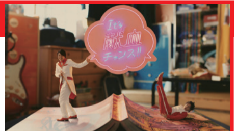
「いこう！献血」新CM 2022年3月31日まで放映中