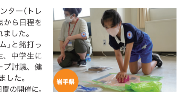
心肺蘇生の方法やAEDの使い方を学ぶ講習も実施

青少年赤十字リーダーシップ・トレーニング・センター(トレセン)が新型コロナウイルス感染症の拡大防止の観点から日程を短くするなどの工夫を重ねつつ、全国各地で開催されました。岩手県支部によるトレセンは「スタートプログラム」と銘打って小規模かつ短期間で集中的に実施。教員、小学生、中学生にそれぞれクラスを分け、竹ひごタワー作りやグループ討議、健康プログラムとして心肺蘇生やAEDの使い方を学びました。香川県支部もトレセン初の試みとして合宿なしの2日間の開催に。参加人数を半数以下に絞り、県内小中高生41人が参加して、防災コミュニケーションのワークショップや救急法などのフィールドワークで絆を深めました。山口県支部のトレセンはオンラインで開催。県内の小学生22人と高校生13人が参加し、インターネットを通じた共同作業に積極的に取り組みました。