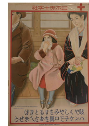
「咳するときはハンケチで」。子ども向けに保健衛生知識を啓発したポスター(1920年代)