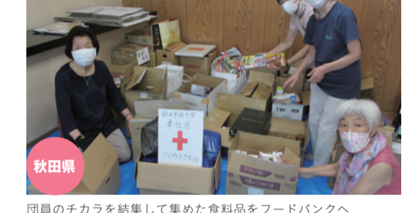
団員のチカラを結集して集めた食料品をフードバンクへ