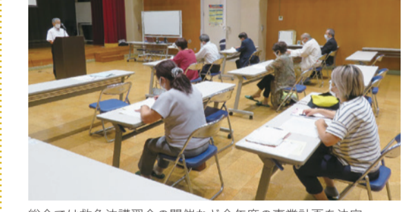
総会では救急法講習会の開催など今年度の事業計画を決定

東日本大震災による原発事故により、福島第一原発に隣接する富岡町では町全域に避難指示が出され、富岡町赤十字奉仕団も活動休止に。しかし、避難解除で町に戻った人々の中で「避難先で他県の日赤奉仕団の支援を受けて勇気づけられたから…」と、10年6カ月ぶりに奉仕団を再開。9月1日、総会に参加したメンバーたちは赤十字奉仕団としての決意を新たにしました。