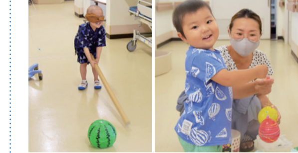
(左)小さい子から順番にスイカ割りにチャレンジ！ 医師も飛び入り参加

8月4日、成田赤十字病院の小児科病棟で夏祭りを開催しました。長期入院中の子どもたちに夏休みのひとときを楽しんでもらおうと小児科レクリエーションチームが企画したもので、当日の病棟にはカラフルな手作り屋台がずらり。子どもたちはヨヨー釣り、輪投げ、的当てなどに家族と一緒に挑戦し、楽しそうな声とたくさん笑顔が病棟にあふれました。