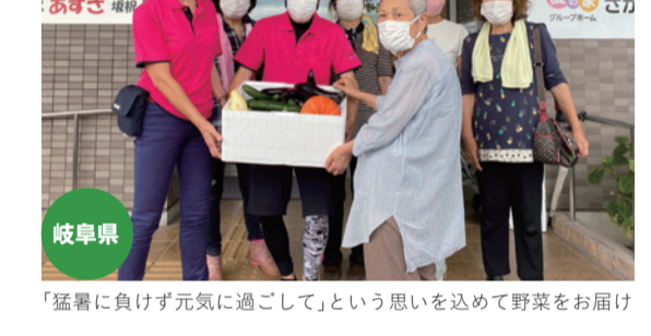
「猛暑に負けず元気に過ごして」という思いを込めて野菜をお届け