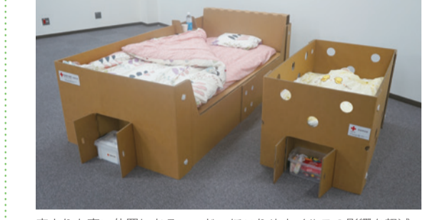
床よりも高い位置にあるベッドではこりやウイルスの影響を軽減

日赤徳島県支部は9月6日、全国に先駆けて作製した、障害者など要配慮者および乳児向け2種の段ボールベッドの贈呈式を松茂町で開催しました。配慮が必要な人が避難所で困難な生活を強いられていることを医療救護班が把握し、赤十字乳児院や総合療育センターも擁する同支部独自の視点で開発に注力。今後は、県内各地に配備を進め、災害支援に活用する予定です。