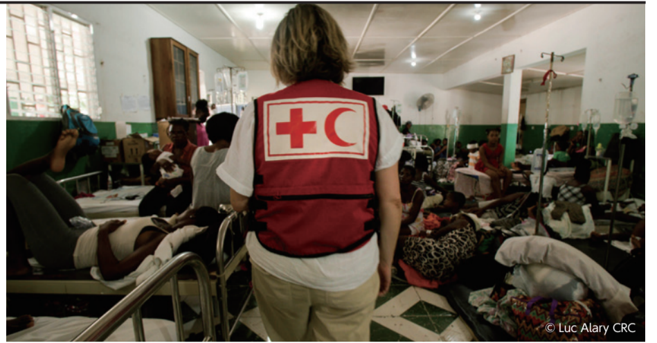
被災地で多くの医療機関が壊滅するなか、治療が可能な病院では床にまで傷病者があふれた