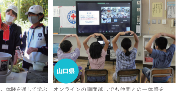
「体内の血液量はどれくらい？」。体験を通して学ぶ オンラインの画面越しでも仲間との一体感を